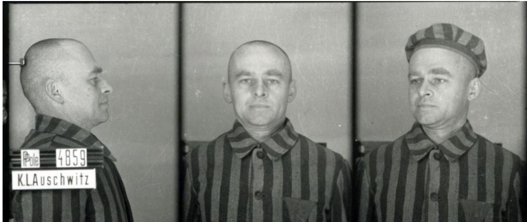
Witold Pilecki jako więzień KL Auschwitz. Oświęcim 1940 r.